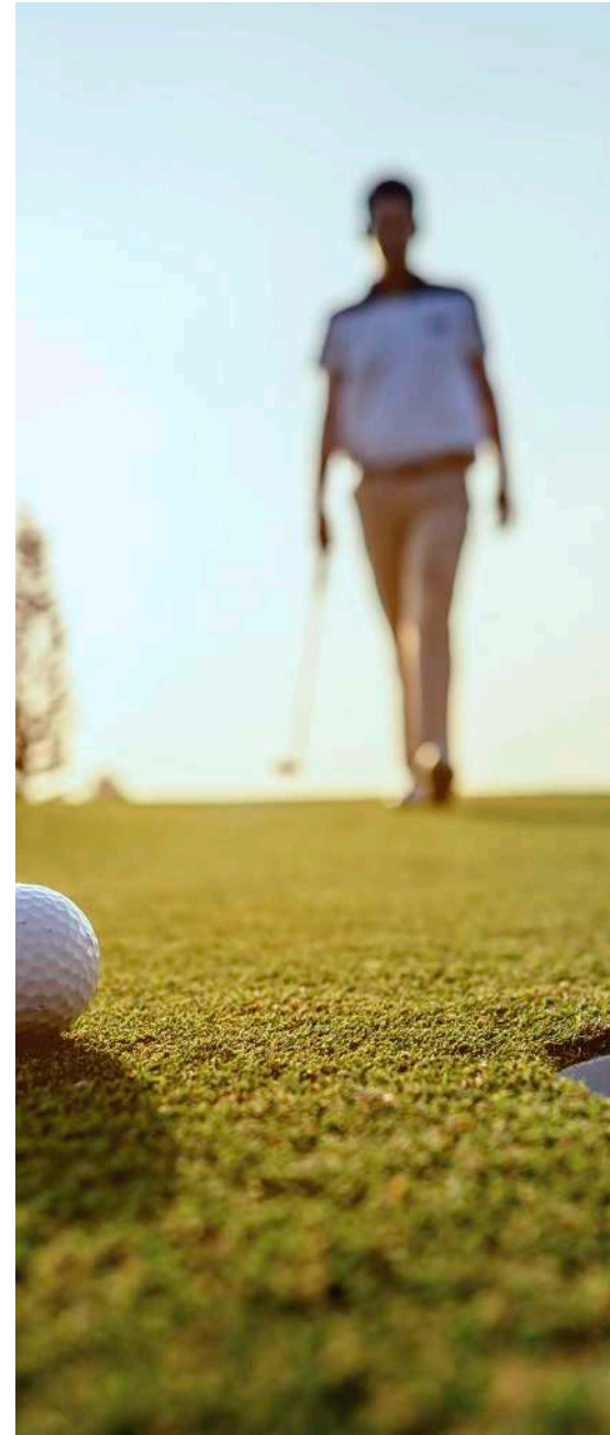
6 golf courses within a 15 km radius 6 campos de golf en un radio de 15 km