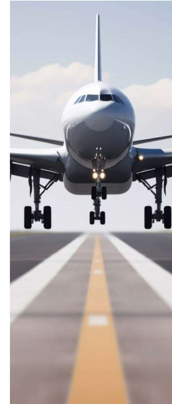
22 min from Malaga International Airport A 22 min del Aeropuerto Internacional de Málaga