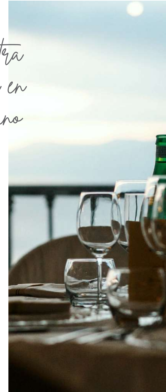
In the heart of the Costa del Sol En el corazón de la Costa del Sol